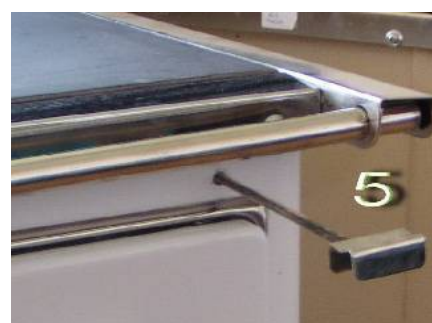
Regulátor provozu (všechny modely)

Sporáky jsou určeny k přípravě jídla (vaření, pečení) a k vytápění obytných prostor. Konstrukcí i způsobem používání se výrazně liší od klasických sporáků na pevná paliva, protože mají možnost regulace režimu provozu (má 4 režimy) a nastavení přívodu vzduchu pro spalování. Tyto přednosti umožňují větší účinnost a lepší stupeň využití tepelné energie. Pracovní plocha sporáku je tvořena chromovaným rámem a ocelovou plotnou.